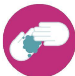
LIMPIEZA DE MANOS